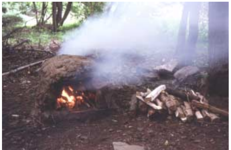
Roztápí se táborová pec na křupavoučké rohlíčky

„Sraz jsme měli ráno mezi čtort na sedm a půl sedmé u klubovny. Tam jsme naložili všechny věci do dodávky, která už tam čekala. A pak jsme se jen rozloučili s rodičema, vyslechli si jejich kázání a příslib, že se za námi přijedou podívat a vydali se směrem k hl. n. / Dopoledne bylo ryze pracovní. Zrobila se latra umývárka a jiné drobnosti co byly třeba pro chod tábora. Po obědě jsme chvíli spočli a zase pokračovali v práci. Okolo páté dojely Tomáš a Evička./ Ráno nás jako pokaždé vzbudil Tom ranní písni s malým prohrěškem podle trestního zákoníku o buzení par.