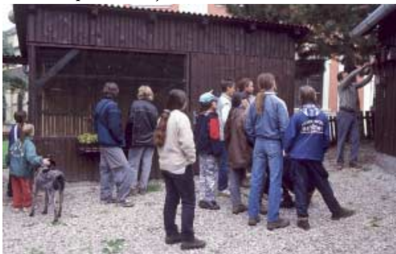
Se zájmem pozorujeme výklad o ptačích budkách

Omrkli jsme místní zámeckou zahradu a skočili jsme se podívat do informačního centra. Pak jsme konečně dorazili do stanice pro záchranu ohrožených zvířat. Byli tam k vidění například rarozi, motáci, káňata nebo sovy. Jejich nejvzácnější pták byl orel mořský, kterého jsme viděli taky. Pán, který nás stanicí provázel, nám u každého ptáka řekl, proč se k nim do stanice dostal. Nejvíce ptáků bylo popáleno elektřinou. Taky nám řekl, že někteří ptáci budou moci být vypuštěni do přírody, ale jiní tam musí zůstat, protože si zvykli na lidi. Potom jsme měli možnost si prohlédnout vajíčka a siluety ptáků, kteří ve stanici nejsou. Potom jsme se rozloučili a vydali se zpátky. Chtěli jsme se ještě na něco dobrého stavit v cukrárně, ale bylo zavřeno, a tak jsme se ploužili do Studénky. Po cestě nás zastihl déšť, a tak jsme do Studénky dorazili „trošku“ mokří. Občerstvili jsme se u místního stánku, nasedli jsme do vlaku a bez nehod dojeli domů a tím skončila tato výprava do Bartošovic.