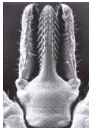
Speciální ústní otvor k probodnutí upevnění na kůži

do těla dostat i zárodky nemocí. Proto taky na prisáté klíště většinou narazíte až po několika dnech. Samičky nasají 0,2-0,6g krve. Tělní pokryv klíštěte je navíc poskládaný do jemných vrásek, které se mohou při sání velmi rychle roztáhnout a tak zvětšit svůj objem až 120krát. Část nasáté krve použijí samice k tvorbě vajíček a většinou po jejich naklazení hynou. Zbytek si nechávají jako krevní konzervu. Vydrží při teplotě 15 °C bez potravy přes zhruba 3,5 roku. Hlavními smysly klíšťat jsou čich, chuť a hmat a jsou umístěny na chodidlech. Pomocí těchto vjemů je klíště schopno na vzdálenost 1-2m zjistit svou možnou budoucí oběť. Zaujímá útočnou pozici, zvedá první pár nohou a snaží se přichytit na hostiteli. Tak to bylo krátce o klíštěti. Dávy