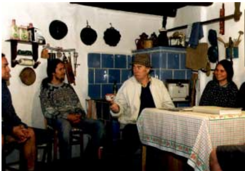
Navštívili jsme i muzeum v bývalém větrném mlýnu v Rudicích