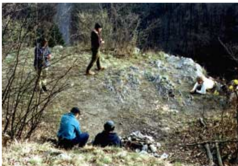
Nad Byčí skálou, kousek od ní jsme přespali