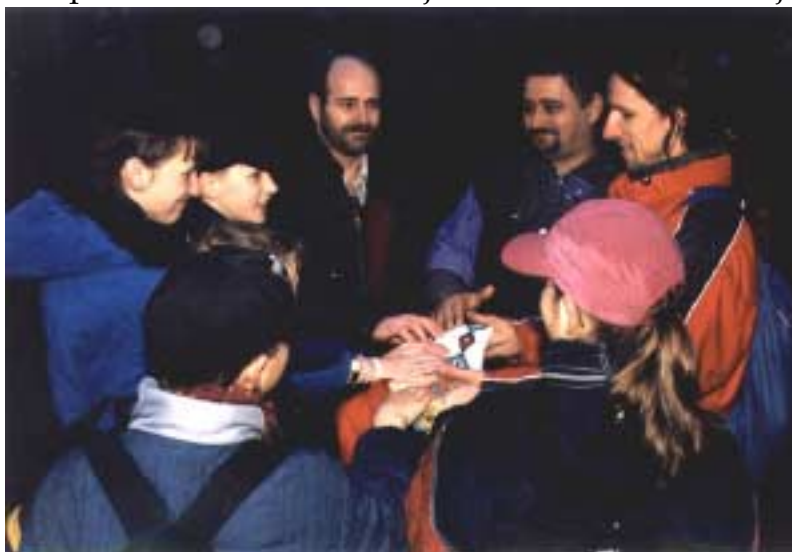
Všichni noví přísahali na kmenovou dýmku

ti, kteří jsou na přísahat, že kde je ukryta toto místo ve svém srdci. kdy mělo vyjít jsme marně, letos neviděli. modlitbu jsme vykopat písmák Gabula listinu datum a jsme se všichni podepsali. Pak