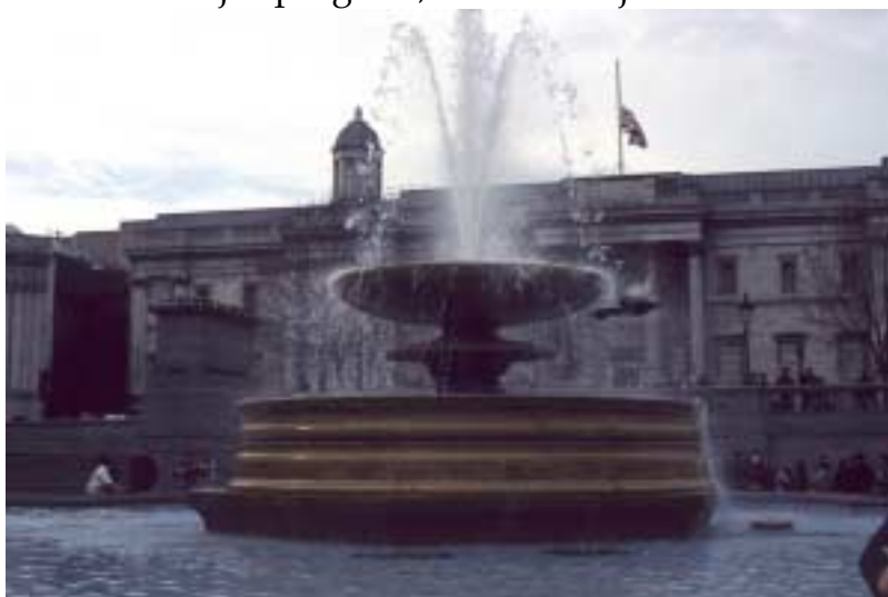
Fontána před national gallery

vystoupit se svým názorem a vykládat co chce a jak dlouho chce. My jsme se však opět odpojili a vydali se do britského muzea, kde jsme zhlédli starověké umění a různé další zajímavosti. Vybrali jsme si oblast Egypt, tam toho bylo. Celý areál prohlédnout, to je tak na týden, za den ani náhodou. K muzeu jsme dojeli metrem. Lístek stál na jednu zónu libru šedesát a je to na jedno použití, platí to pořád, dokud nevylezete z metra. Celkem jsem projedil asi tak 9 liber. Ale je to sranda. Metro je o hodně větší než v Praze a má taky více úrovní. Odpoledne jsme jeli na zámek Windsor. Je to sídlo královské rodiny. Museli jsme projít přes různé detektory, jestli náhodou nemáme něco nebezpečného u sebe. Zámek je to fakt masivní. Viděli jsme i příjezdět prince Wiliama s rodinou. Po střídání stráží jsme ještě prohlédli ostatní věci, například kde se scházejí členové rodiny při udílení titulů. Mají tam taky vystavenou kulku, která zabila Nelsona. Po příjezdu k rodině jsme naposledy povečeřeli a dívali se na Gladiátora, zrovna běžel v televizi. Balení jsme nechali až na ráno. Ráno jsme museli celkem brzy vstávat, abychom to všechno stihli. Pro dnešní den jsme zvolili volnější program, navštívili jsme Britské válečné muzeum, do kterého je vstup