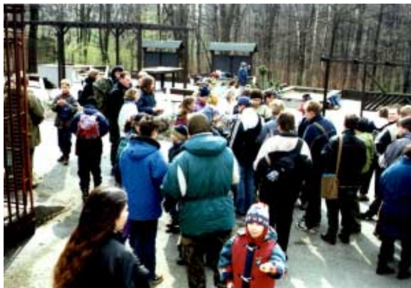
Po vyhodnocení se rozdávali camrátko a zvadla

My z Michálkovic a okolí jsme přijeli všichni jedním trolejbusem. Až na pár výjimek,