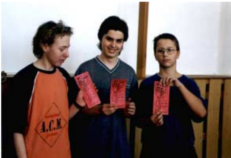
Manga obsadili místo první...