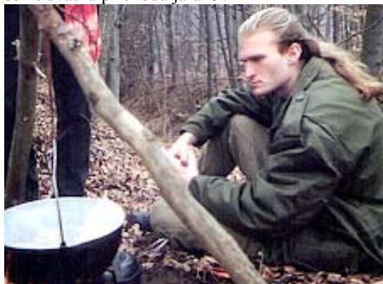
Náčelník a jeho zaujetí při vynalézání oběda.

Prý jej moc potěšilo, že jsme svátky jara oslavili v přírodě na jeho milované Oslavce. Parádní vandr ukončíme až ve vlaku plném kamarádů zéesáků mezi nimiž jede i pár dalších Vlků. Od těch jsem si půjčil žilu, abych splnil očekávané povinnosti vztahující se ke svátku příchodu jara ☺.