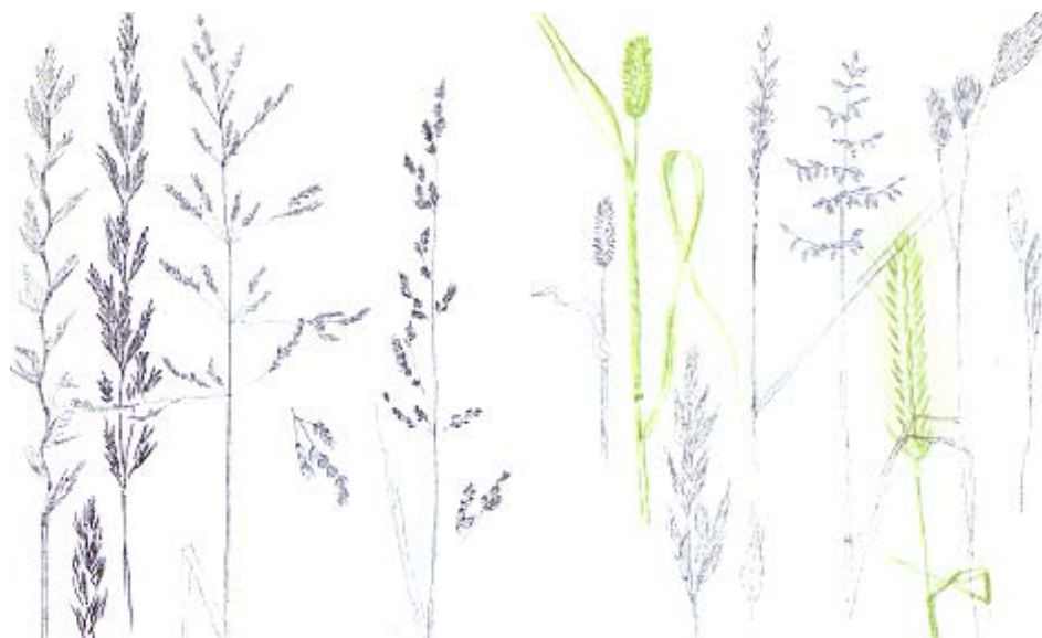
Ukázky našich trav

Co na ten nápad říká vlčí veřejnost? Mohl bych na stránkách Vlčovníku přinést návod na splnění těchto činů.... Pokud bude zájem. Je škoda chodit přírodou v tomto nádherném období se zavřenýma očima.