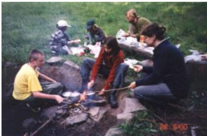
Vaření na výpravě do Mor. Krasu (Norbertka - zde byl v roce 1993 tábor Vlků)