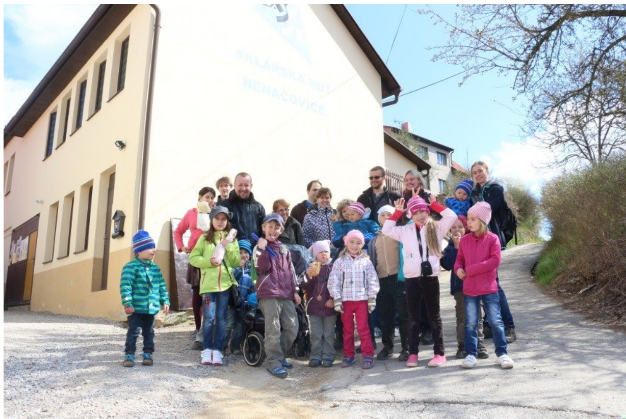
Jarní výprava do sklárny v Nenačovicích

Náš kmen má 20 členů, 11 dětí a 9 dospělých. Na výpravy s námi jezdí i další kamarádi.