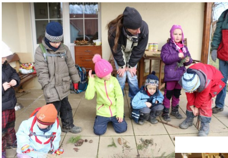
Poznáváme jehličnaté stromy