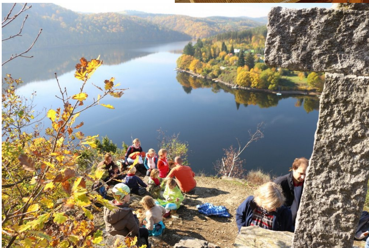
Výprava do Hrazan