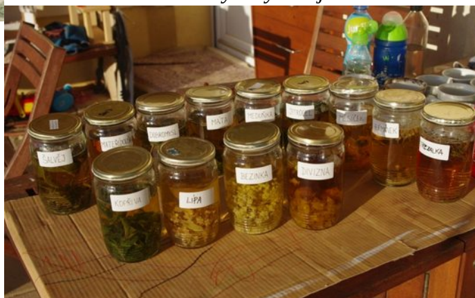
Léčivé bylinky a čaje