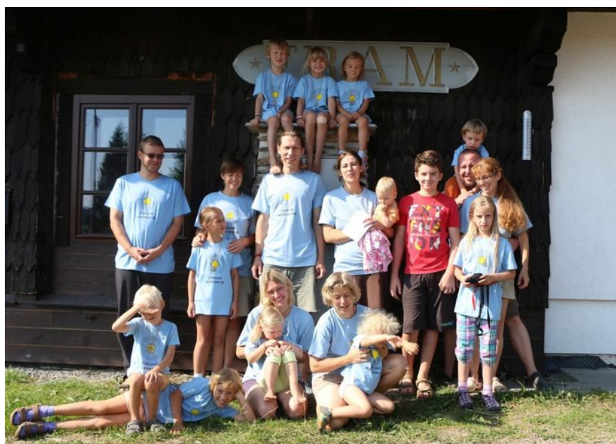
Závěr letního tábora na Framu

Náš název znamená ve volném překladu „Děti posvátné hory“ - tou je pro nás Skalka, vypínající se nad Mníškem. Od tohoto názvu se odvíjí i podoba našeho znaku, kde cesta má zároveň symbolizovat naši snahu „stoupat na horu“ v duchu woodcraftu.