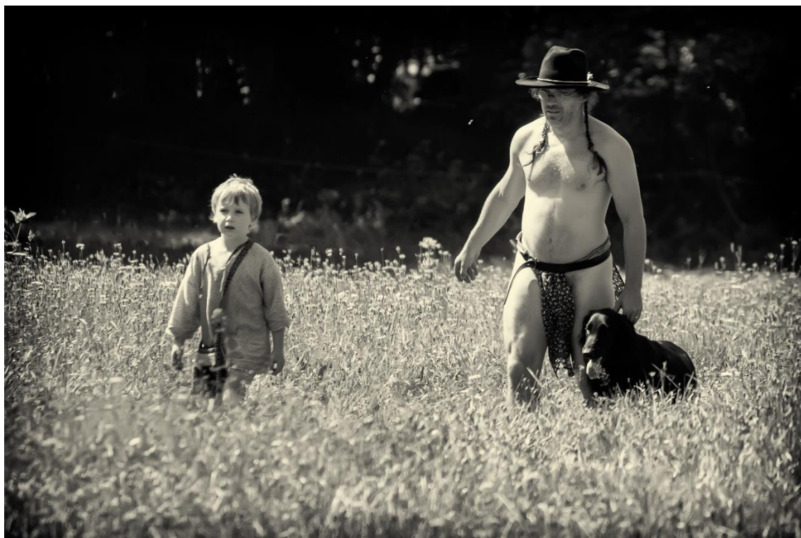
z táboření na Kosím potoce