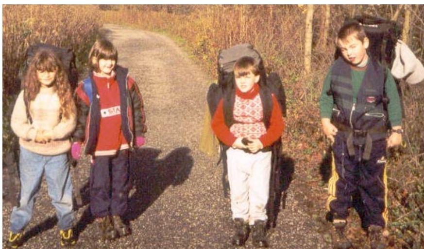
Batůžci s nožičkama v akci

A všichni se těšíme, že příště s námi pojedete i vy ostatní a bude ještě víc legrace.