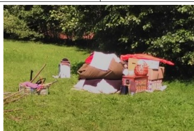
tady bude tábor