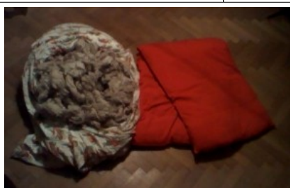
vypraná vlna a matrace z vlny