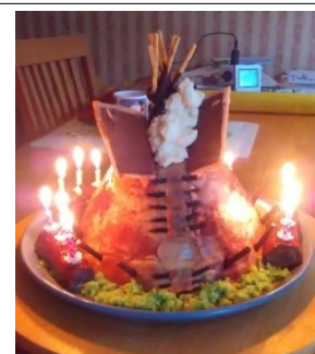
tipí k nakousnutí