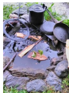
nové využití ohniště