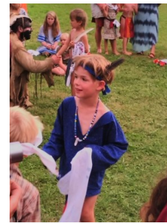
slunce je zachráněno