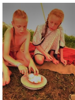
snídaně v tipí