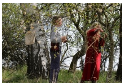
u stromu lásky