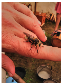
setkání jiného druhu