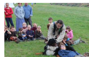
povídání o pejscích