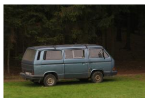
užili jsme si starého busíka