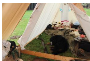
stanem nám tekli potůček