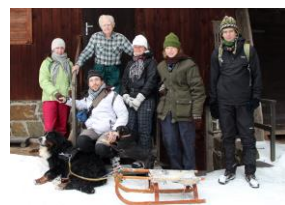
setkání s Bobrem