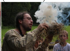
rozdělávání ohně bez sirek