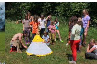
jak se staví týpí