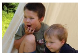
děti byli nadšené