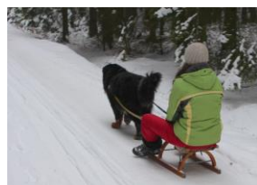
sáňkování s Indym