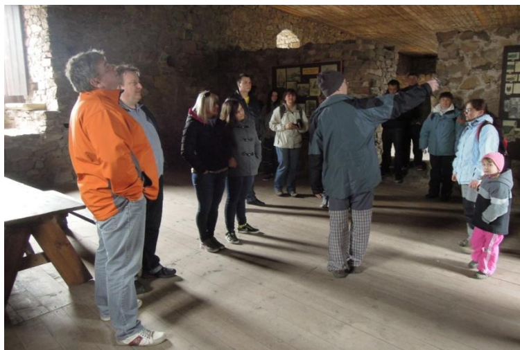
Vojenská pevnost Králíky