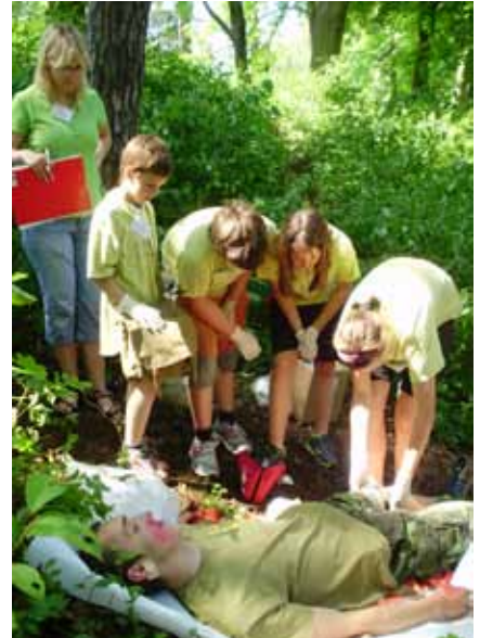
Hra o přežití / Jaroměř (16. 9. 2011)