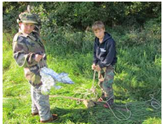
Celostátní vzájemná výměna zkušeností/ Hradec Králové (17. - 18. 10. 2011)