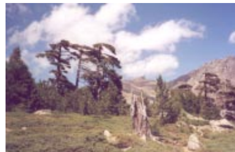
(nav. náčelník Šedivá skála)