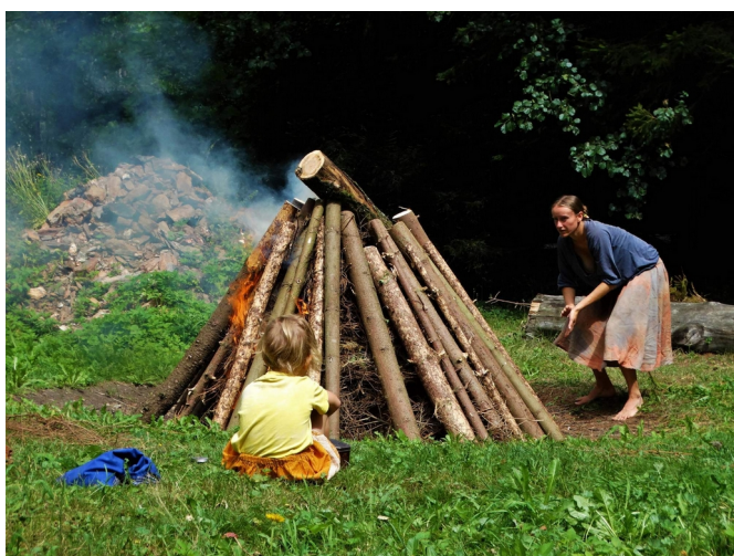
Zapalování ohně na iníti