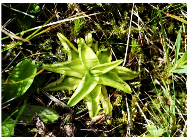
Pozorování tučnic cestou na Zhůří

V rámci tábora proběhl tradiční sněm kmene, kde jsme si kromě jeho slavnostní části věnované udělování Orlich per a Titulů užívali hlavně naši oblíbenou hru na psychiatra.