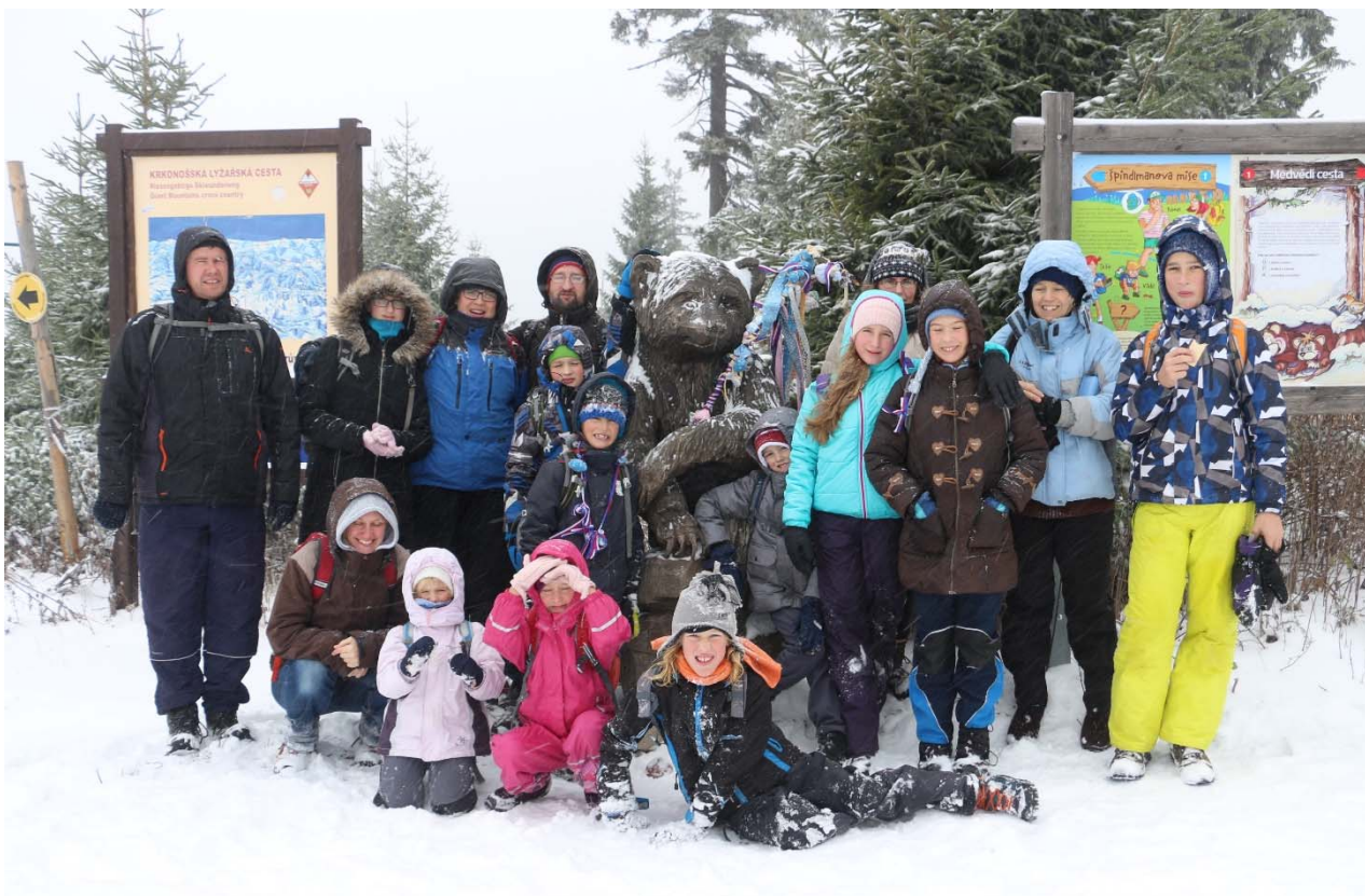
28. 10. 2018 – místo původně plánovaného výstupu na Sněžku alespoň Medvědin ☺