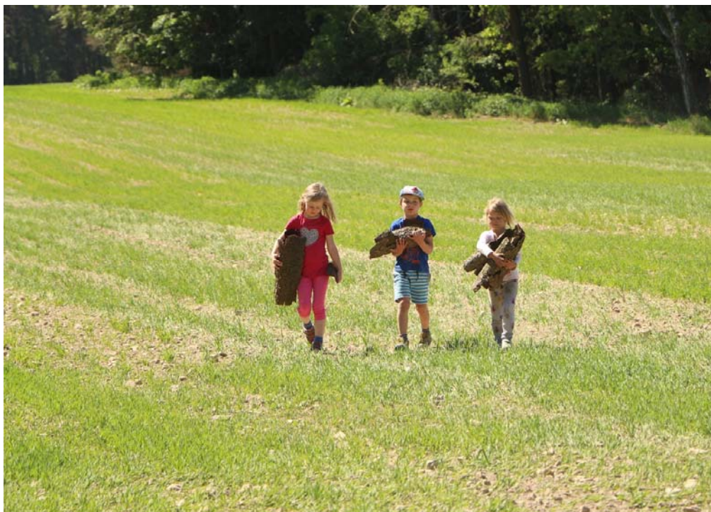
Na farmě Želichov