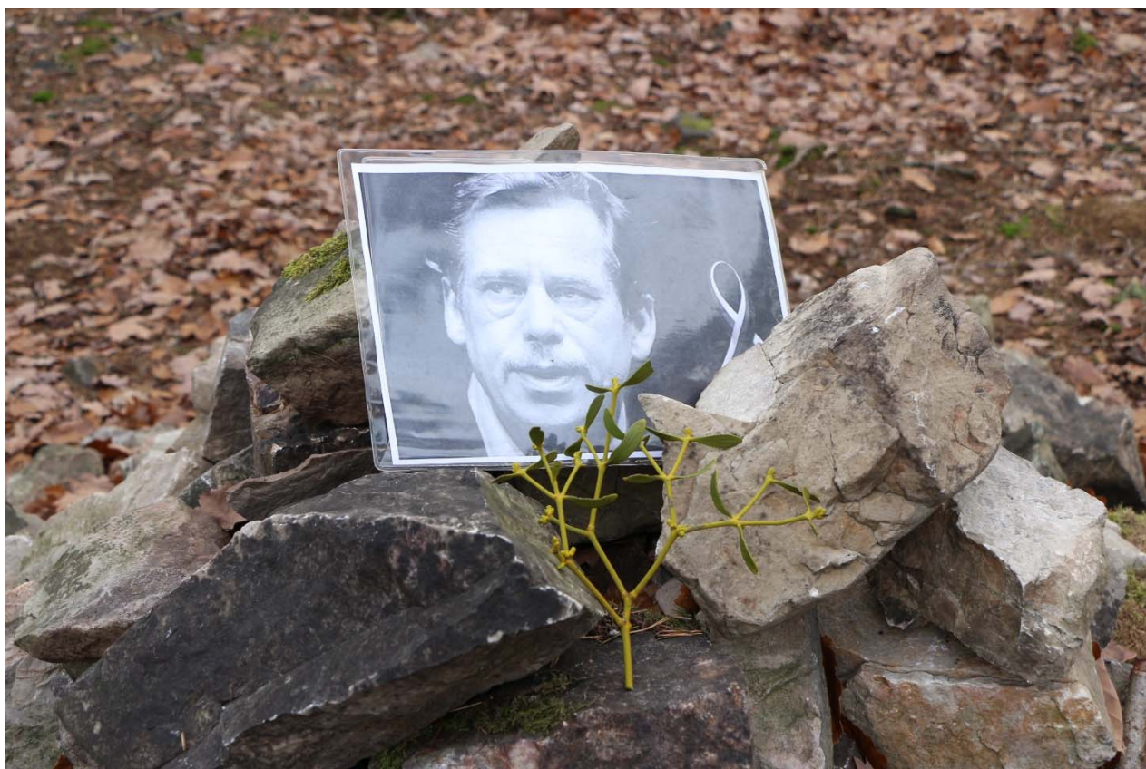
Výprava na vyhlídku Hvízdinec