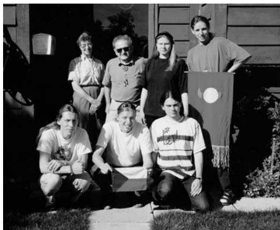
Naše výprava před Klenovým domem

Ke Klenovi jsme měli naplánováno přijet v odpoledních hodinách. Již od rána jsme v Edmontonu. Ráno byla zima naprosto ukrutná, takže seržant GU zavelel úderem sedmé posádce k naložení do korábu. Centrum Edmontonu nebylo ani moc velké, řekl bych tak 0,5 x 0,5 km. Co má být v Edmontonu, hlavním městě Alberta, k vidění, jsme nepochopili ani s hromadou prospektů, které jsme tak různě sezbírali. Jediná hojně inzerovaná pozoruhodnost, která byla v samém centru, byl unikátní Edmonton peed way systems. Jednalo se o to, že všechny mrakodrapy byly propojené sítí podchodů, nadchodů a průchodů. Takže člověk, který jede nakupovat, pracovat nebo se vzdělávat do centra, zaparkuje auto v jednom z parkingů a suchou nohou projde celé centrum od knihovny přes úřad, až třeba po různá zábavná centra. Systém je dokonale sterilní, ohromující, možná