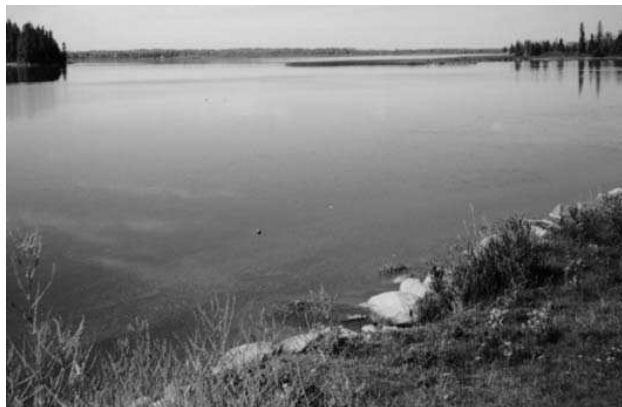
Jezero v Elk national parku

Bod číslo dvě - West Edmonton Mall Jedná se o největší krytou obchodní a zábavní plochu na západní polokouli. Je to systém obchodů, bufetů a atrakcí všeho druhu s cílem co nejlépe oškubat zákazníka. Některé věci tu jsou však opravdu unikátní. Krytý zábavní park se svou obří horskou dráhou svedl některé jedince i k zakoupení jízdének. Na ledové ploše uprostřed obchůdků všeho druhu se prohánějí děti na bruslích. V systému nádrží prolouvají prosklené ponorky, ze kterých návštěvníci pozorují korálové útesy, roztočivné mořské ryby, pirátské poklady i jiné umělé