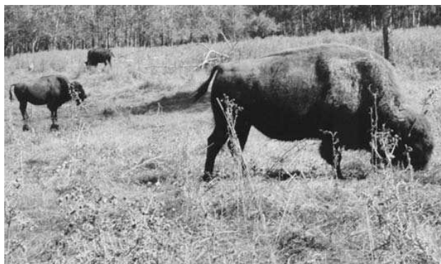
Bizon, pro nás nejzajímavější obyvatel Elk national parku

hrůzy. O pár metrů dále se válejí lidi na pobřeží obrovského bazénu s pravověrnými vlnami. V delfináriu tančí delfíni na rytmus zpěváka Scattmanna.